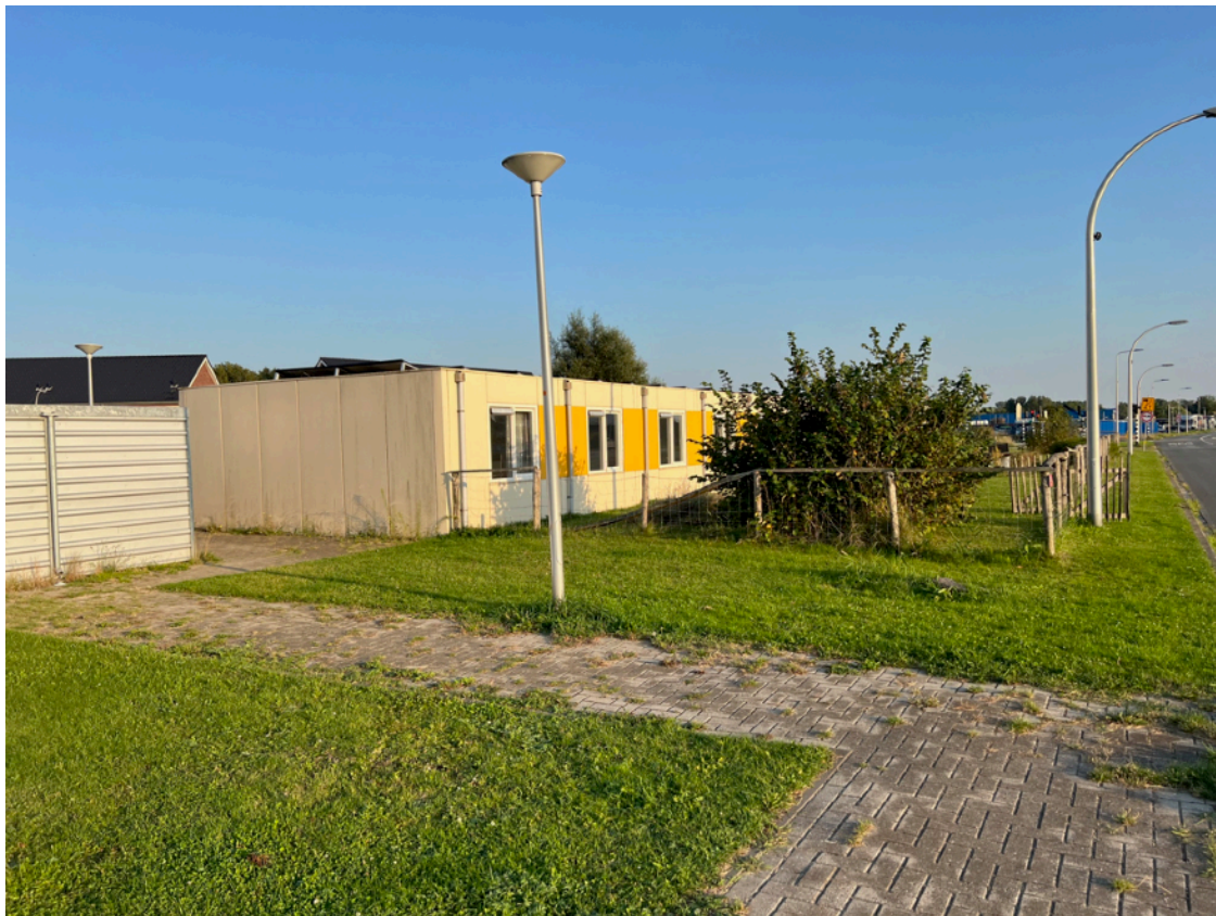
Afbeelding 4: aangezicht van de Sterappel vanaf de busbaan