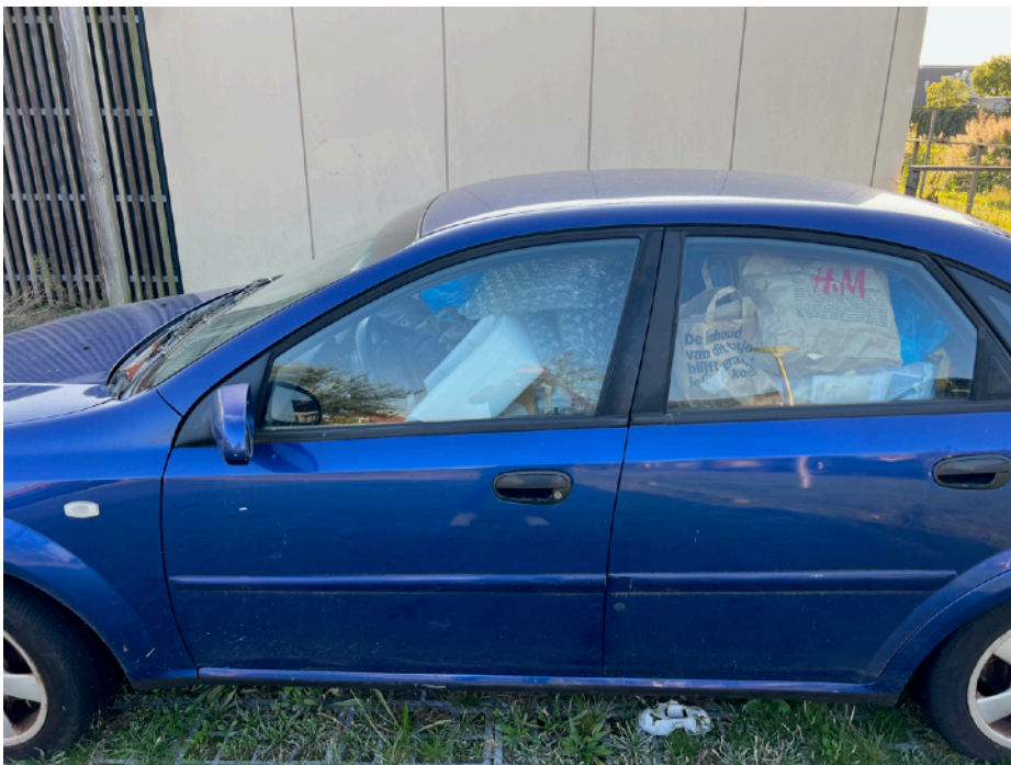
Afbeelding 2: close-up van achtergelaten auto, hierop is te zien dat deze volledig is gevuld met afval