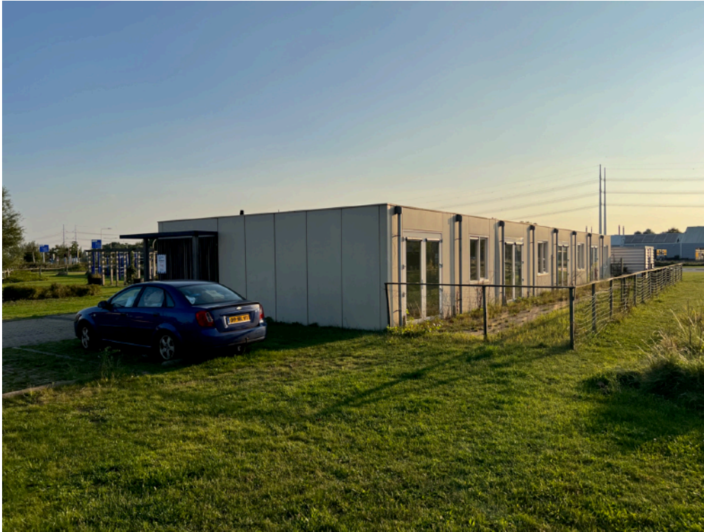
Afbeelding 1: aangezicht vanaf de Molensloot van de Sterappel, inclusief achtergelaten auto.