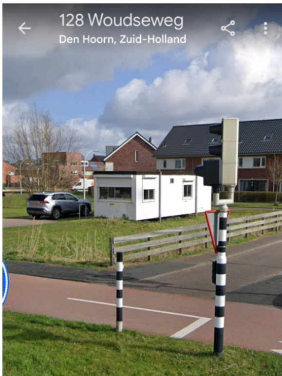
Afbeelding 6: aangezicht vanaf de busbaan voor het verwijderen van de containers