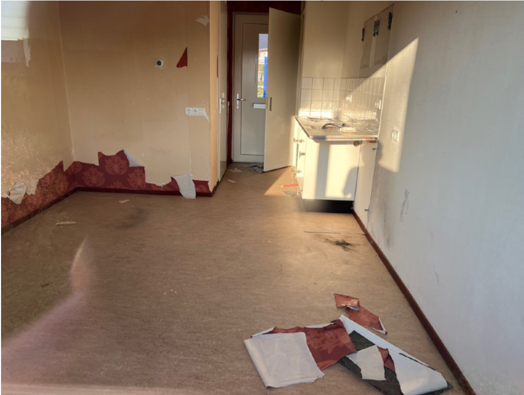
Afbeelding 7: Achtergelaten woning aan de Sterappel, inclusief vernielde keuken