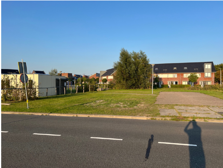
Afbeelding 5: aangezicht vanaf de busbaan, op het geasfalteerde deel zijn de containers al wel verwijderd.