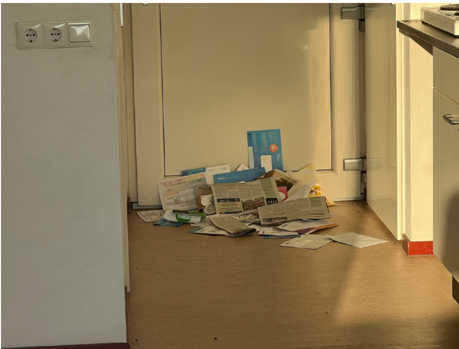
Afbeelding 8: Achtergelaten en bezorgde post aan een woning aan de Sterappel