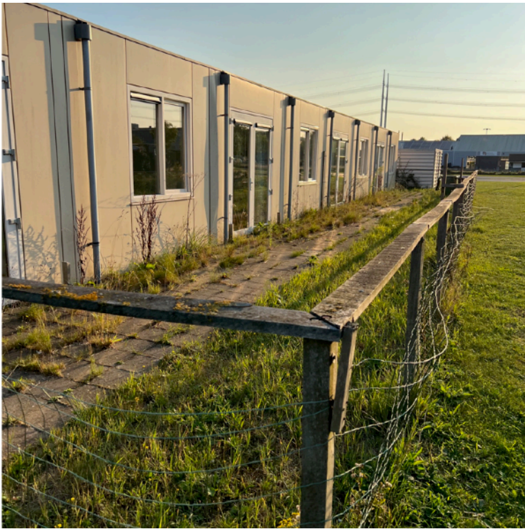
Afbeelding 3: aangezicht van de Sterappel vanaf de Molensloot